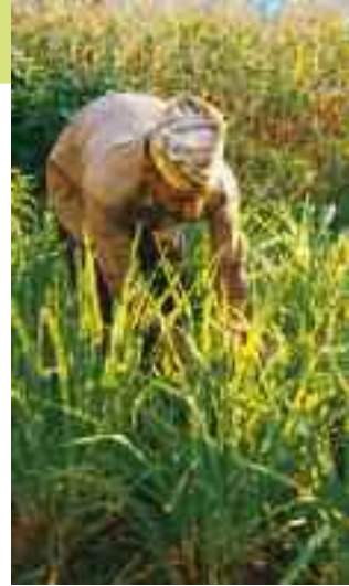
Parc, Palestina, una delle più importanti Ong palestinesi, coinvolge oltre 1300 agricoltori.

Proteggere la biodiversità significa proteggere l'ambiente e le sue risorse, restituire ai contadini il loro ruolo tradizionale e valorizzare le loro competenze e il loro sapere, mettendoli in grado di coltivare, accanto a ciò che si vende sul mercato, anche ciò che serve alla loro alimentazione. In definitiva, garantisce il diritto al cibo .