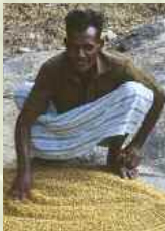
Podie, Sri Lanka

La crisi alimentare che stiamo vivendo non è un evento inaspettato, legato ai maggiori consumi di Cina o