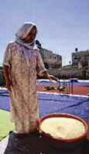
Parc è impegnata in programmi di sviluppo fondati sulla promozione della produzione agricola.