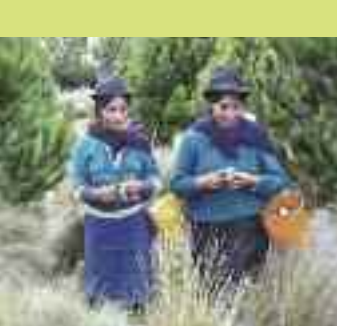
Produttori di funghi, Mcch, Salinas, Ecuador