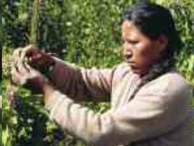
Produttore di Anapqui, organizzazione di produttori di quinoa della Bolivia e partner del movimento del commercio equo e solidale.

“Consumare è un atto agricolo”. Quando facciamo la spesa noi scegliamo continuamente quale mondo preferiamo tra: