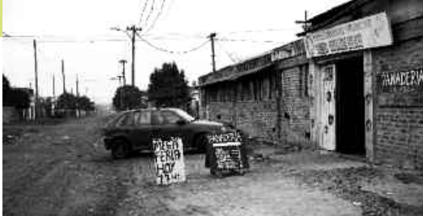
Argentina, panetteria della Cooperativa La Juanita

mico ha contribuito alla disgregazione dei sistemi agricoli regionali e ha prodotto conseguenze radicali per intere comunità, trasformando quelli che erano contadini e piccoli proprietari, spesso autosufficienti, in senza terra costretti al lavoro salariato nelle industrie alimentari o all'emigrazione nei quartieri ghetto delle grandi città.