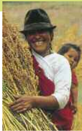
La raccolta della quinoa, Anapqui, Bolivia

Acquistando prodotti di stagione e provenienti da filiere corte guadagniamo in genuinità e riduciamo i passaggi di intermediazione, premiando il reddito di chi produce e non di chi specula.