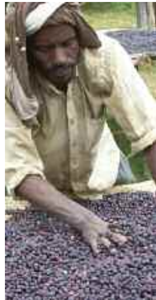
Sidama Union, Etiopia