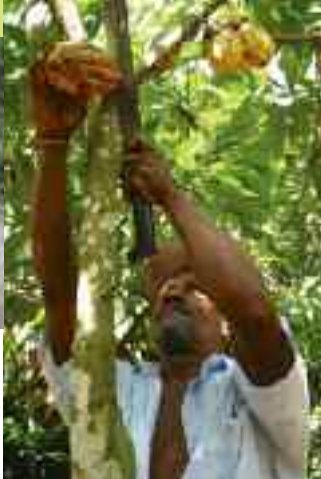
Il lavoro nei campi di chili, Podie, Sri Lanka