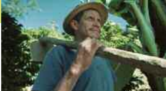
Coltivatore di banane fair trade di El Guabo, Ecuador. El Guabo è un consorzio di 12 realtà cooperative.